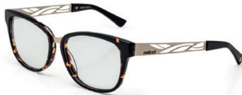
C6056 F30 54