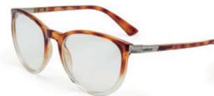
C6059 F64 55