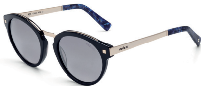
C0065 A34 43