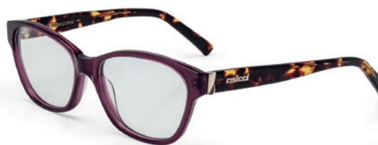
C6052 C19 53