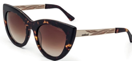
C0037 F69 34