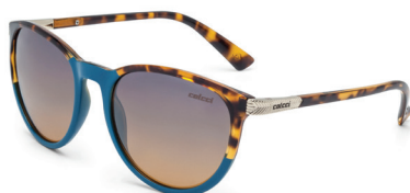
C0030 K34 21