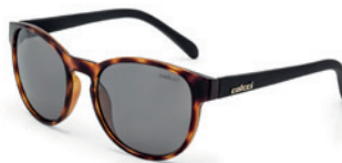
C0057 F52 09