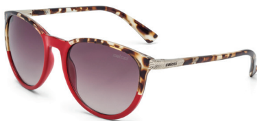
C0030 C39 34

Base: 6 Proteção UV: 100% Apto para grau: Sim