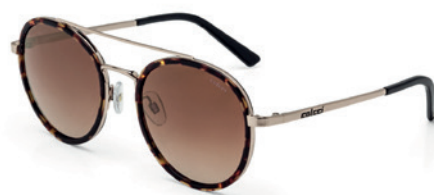
C0042 F47 41