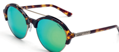
C0061 F30 93