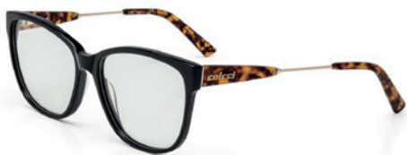
C6058 A34 54