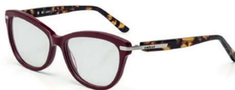
C6045 C28 54