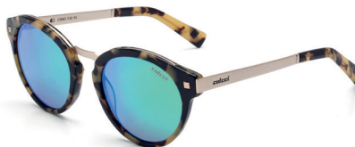
C0065 F30 93