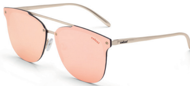
C0068 E11 46