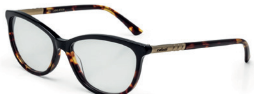
C6042 A73 54