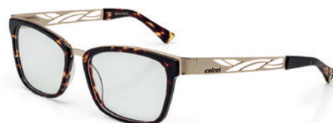
C6054 F30 52