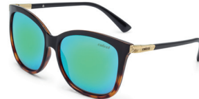
C0059 A53 85