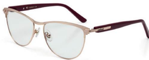
C6048 E11 54