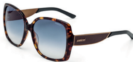
C0022 F42 86