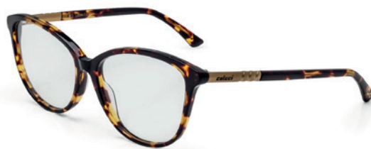
C6044 F30 55