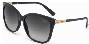
C0059 A43 33