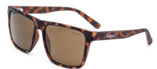
C0062 F74 36