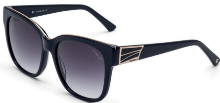
C0060 A02 33