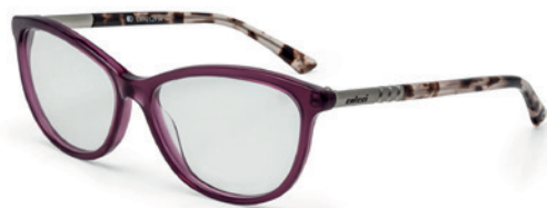
C6042 C29 54