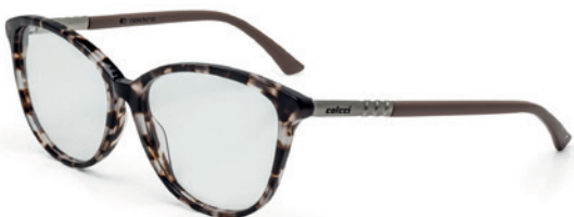
C6044 F67 55