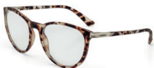
C6059 F69 55