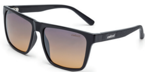
C0062 A02 21