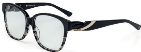
C6040 D53 53

Horizontal: 53 mm Vertical: 41 mm Base: 6