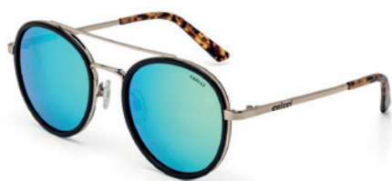
C0042 A34 97