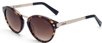
C0065 F47 35