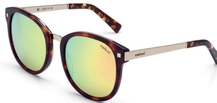
C0064 C27 43