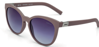
C0070 B20 86