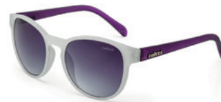
C0057 B13 86