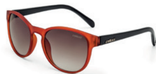
C0057 J43 34