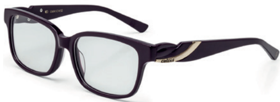
C6041 C14 52

Horizontal: 52 mm Vertical: 35 mm Base: 6