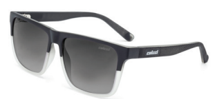
C0062 AA5 33