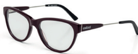
C6057 C28 53