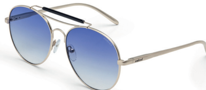
C0066 E10 86