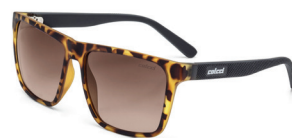
C0062 F59 34