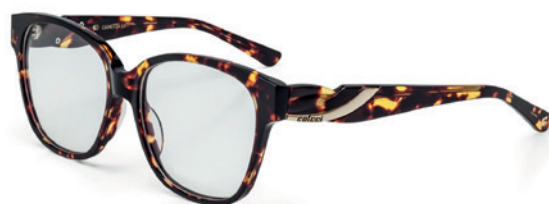
C6040 F21 53