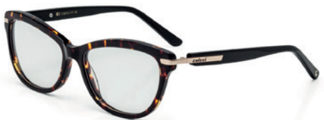
C6045 F47 54