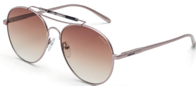
C0066 B12 34