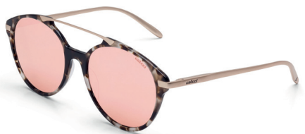
C0069 F70 46