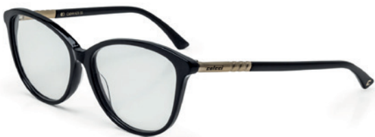
C6044 A25 55