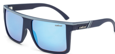
05012 K39 97