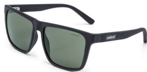
C0062 A14 71