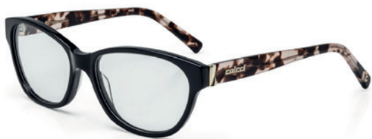
C6052 A79 53

Horizontal: 53 mm Vertical: 40 mm Base: 4