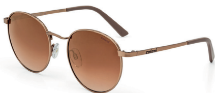
C0041 E11 41