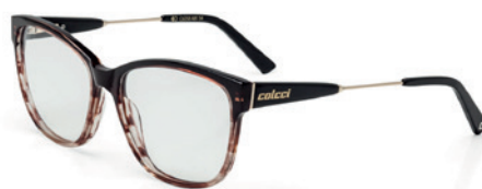
C6058 A81 54