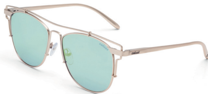
C0067 E10 28