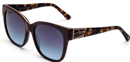
C0060 J08 86