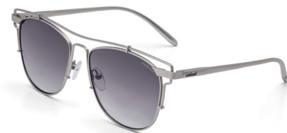
C0067 G08 33