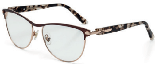
C6048 H04 54