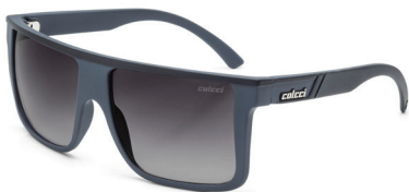
05012 D68 33