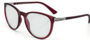
C6059 C32 55