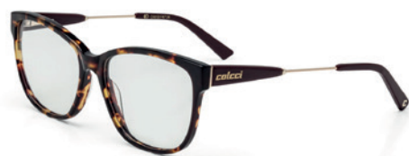
C6058 F47 54