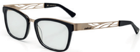
C6054 A25 52