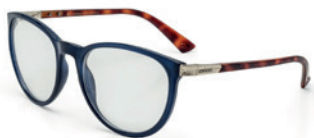
C6059 K19 55