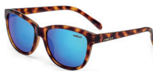
C0058 F41 97