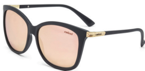
C0059 A14 46