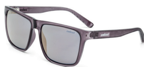
C0062 D49 28