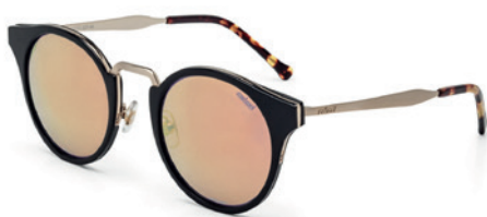
C0032 A25 46