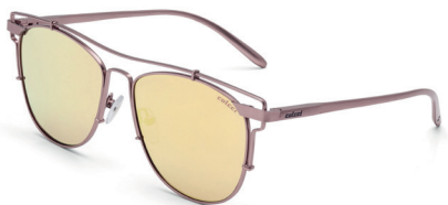
C0067 B12 81