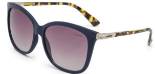
C0059 K35 34