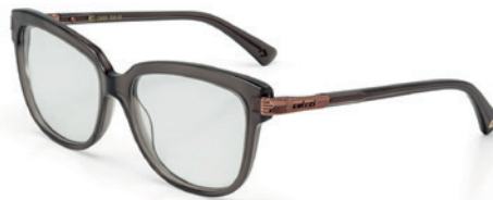
C6050 D20 53