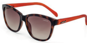
C0058 F71 34