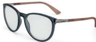
C6059 D50 55