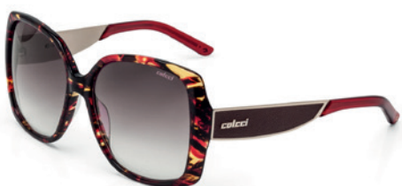
C0022 F48 34