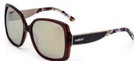
C0022 J13 08