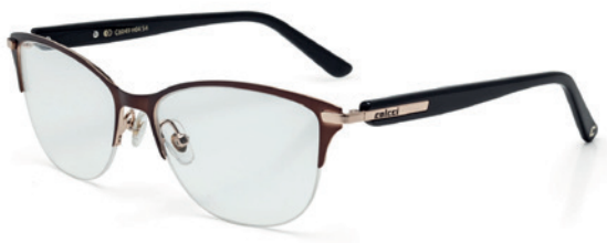
C6049 H04 54