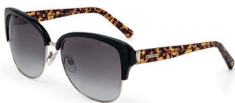
C0034 A77 33