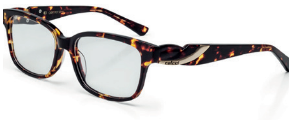
C6041 F21 52