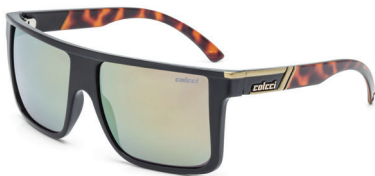
05012 A31 96