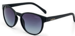
C0057 A43 86