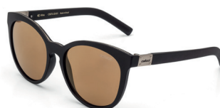
C0070 J20 81