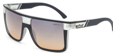
05012 AAI 21