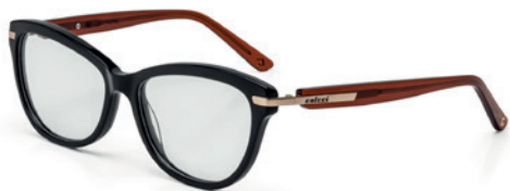
C6045 A25 54