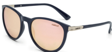
C0030 K15 46