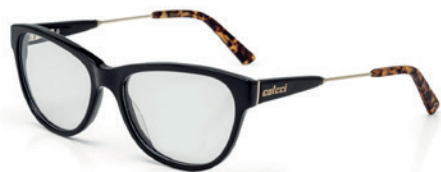
C6057 A25 53