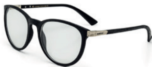
C6059 A68 55