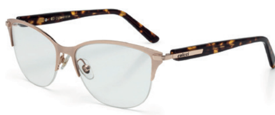
C6049 E19 54