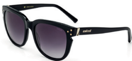
C0035 A78 33

Matéria prima: CR39 Horizontal: 55 mm Vertical: 47 mm Base: 4 Proteção UV: 100%