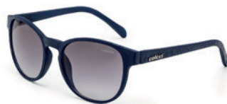
C0057 K16 33