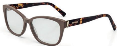
C6053 J11 54