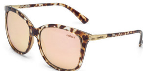
C0059 F75 46