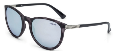
C0030 F76 80