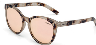
C0070 F79 46