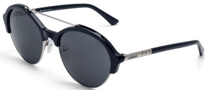
C0061 A34 22