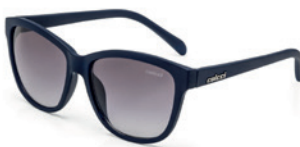
C0058 K29 33