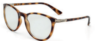
C6059 F47 55