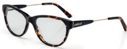
C6057 F47 53