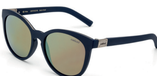
C0070 K33 96