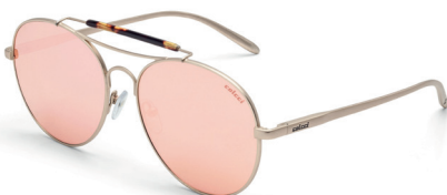
C0066 E11 46