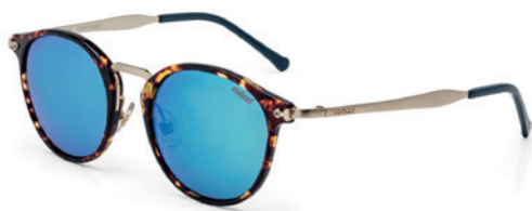
C0031 F30 97