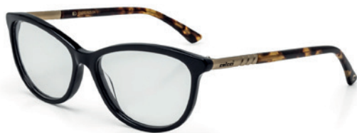
C6042 A25 54