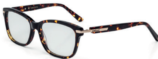
C6047 F47 54