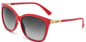
C0059 C40 33