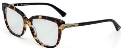
C6050 F30 53