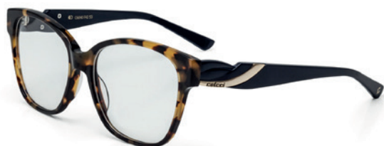
C6040 F42 53