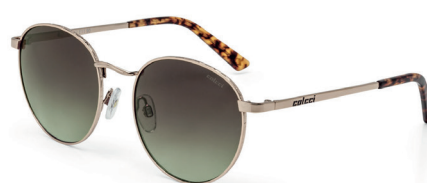
C0041 E10 90