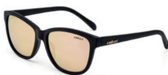
C0058 A14 46