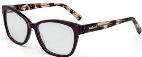
C6053 C19 54

Horizontal: 54 mm Vertical: 41 mm Base: 4