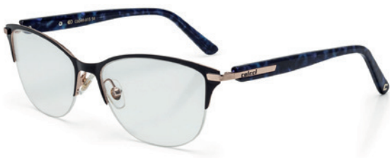
C6049 A15 54