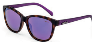
C0058 F72 92