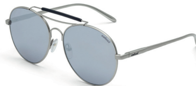
C0066 G02 80