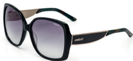
C0022 A35 33