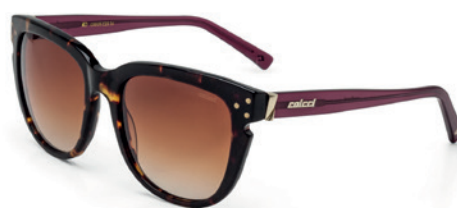
C0035 C23 74