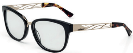
C6056 A31 54