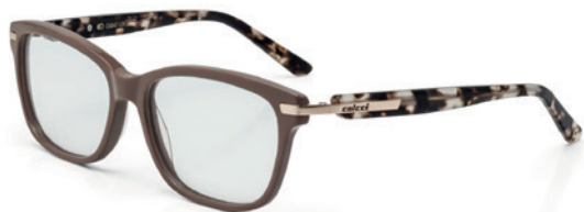
C6047 J29 54