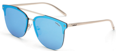
C0068 E10 97