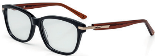
C6047 A25 54