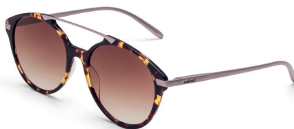
C0069 F58 34