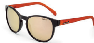
C0057 J33 46