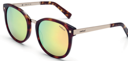
C0063 F47 46