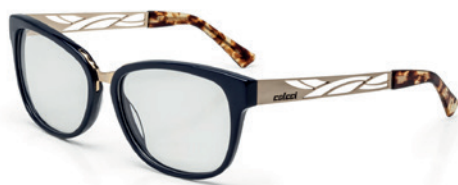
C6056 K14 54