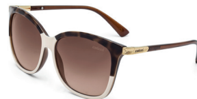
C0059 J38 34