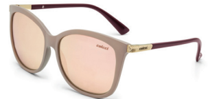
C0059 B19 46