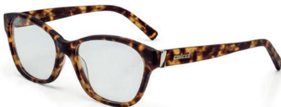
C6052 F39 53