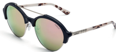
C0061 A70 46