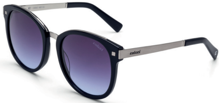
C0064 A25 28