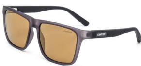
C0062 D21 81