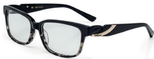
C6041 D53 52