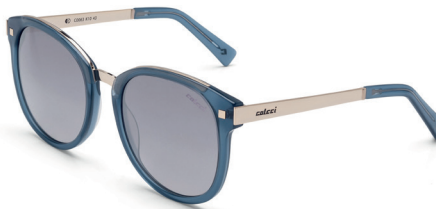
C0064 F47 34