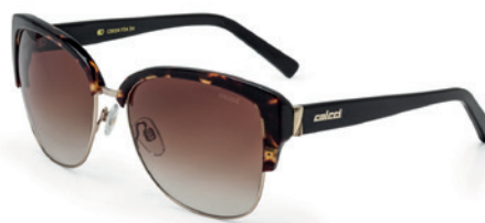
C0034 F34 34