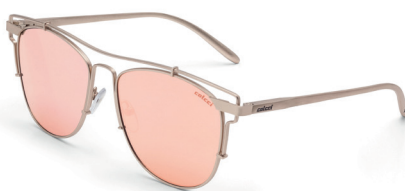
C0067 E11 46