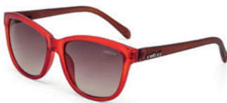
C0058 J35 34