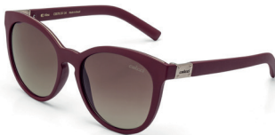
C0070 C41 34