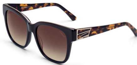
C0060 C19 34