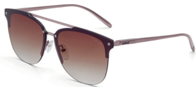
C0068 B12 34