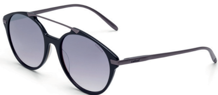
C0069 A89 43