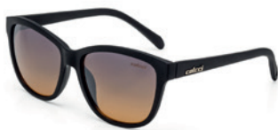
C0058 A14 21

Frontal: 143 mm Haste: 132 mm Ponte: 18 mm