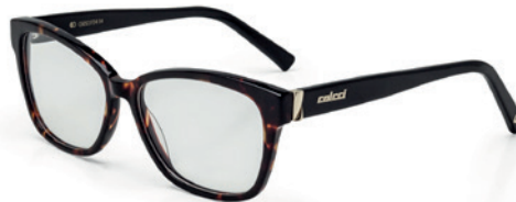
C6053 F34 54