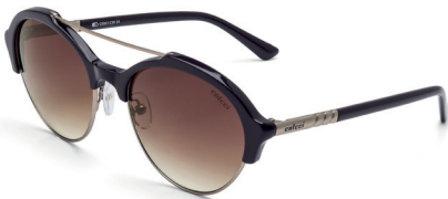
C0061 C30 34