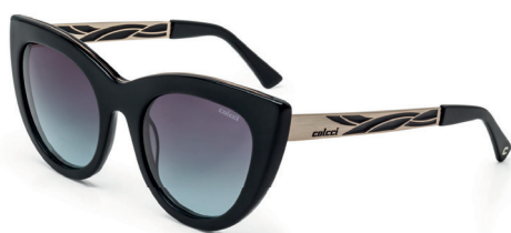
C0037 A25 86