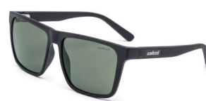
C0062 AA4 89