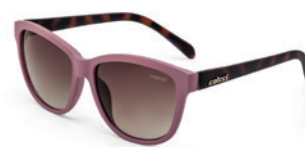
C0058 B14 34