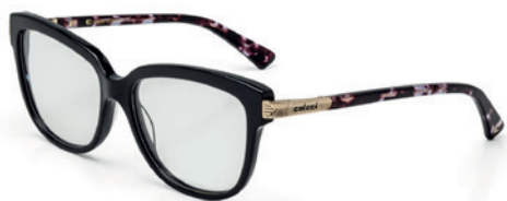
C6050 A34 53