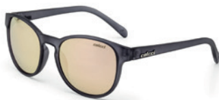
C0057 D22 46