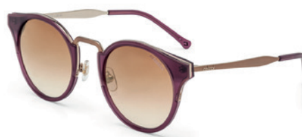
C0032 C30 34