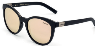
C0070 A14 46