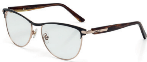
C6048 A70 54