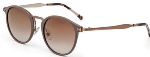
C0031 J29 34