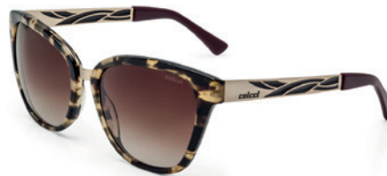
C0036 F46 34