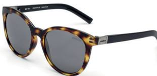
C0070 F44 09