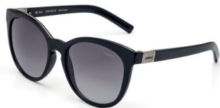
C0070 A02 33