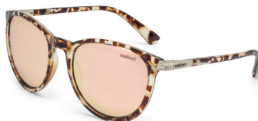
C0030 F75 46