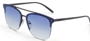
C0068 D16 86