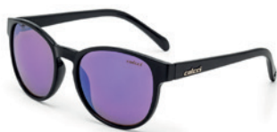
C0057 A02 92