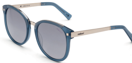
C0063 K10 43