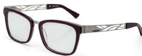
C6054 C29 52