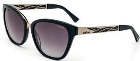
C0036 A25 33